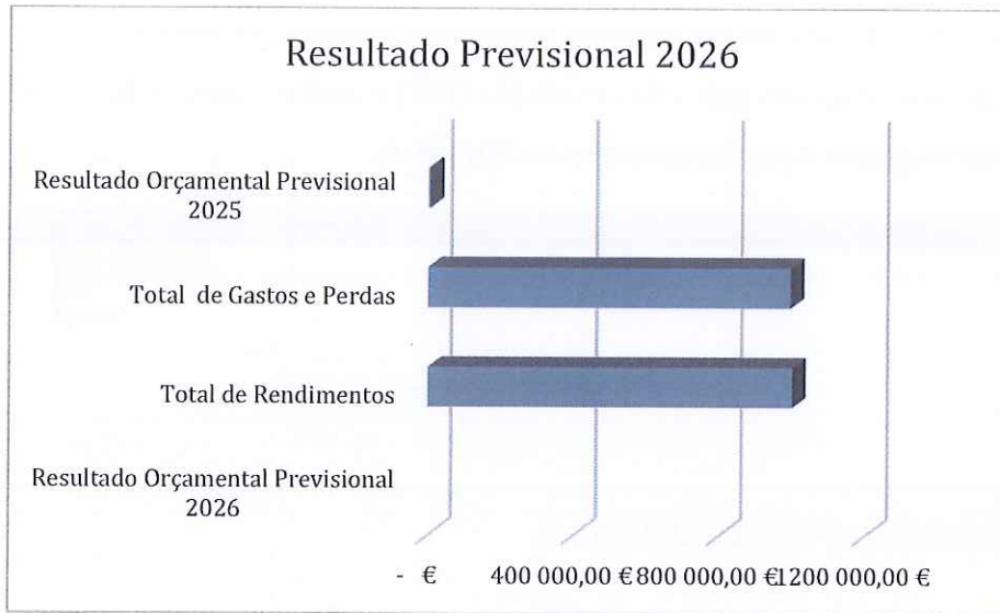
Figura 6 - Resultado Orçamental Previsional 2026